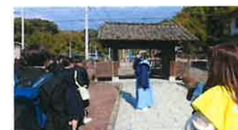
【大津手永会所の御客屋門】