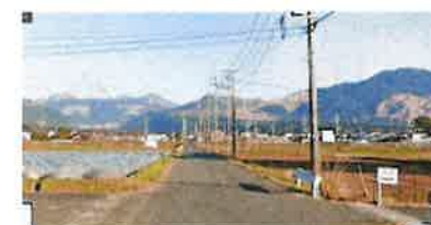
【白川中流域の水田と阿蘇山遠景】