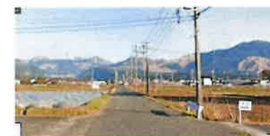
【白川中流域の水田と阿蘇山遠景】