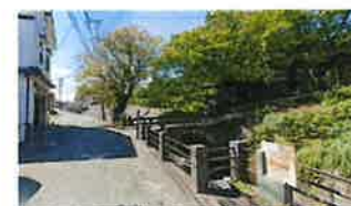
【上井手用水と当時の参勤交代路】