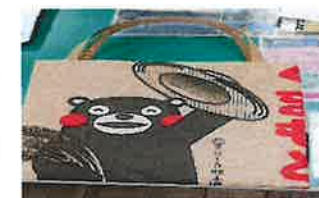
【エコバッグ製作体験の様子とエコバッグ完成品】