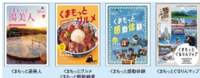
ガイドブック表紙