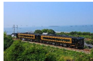
特急「A列車で行こう」