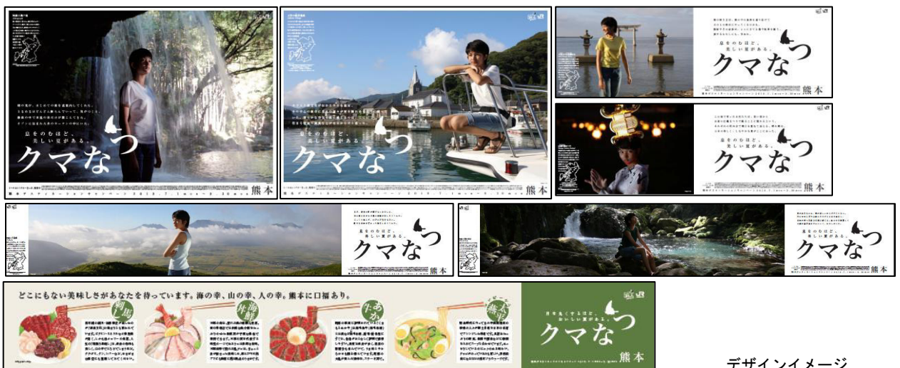
デザインイメージ

今回のポスターのタイトルは「クマなつ」です。熊本の夏を満喫するデザインとなりました。 (掲出時期) 2019年5月24日（金）～9月30日（月）まで全国のＪＲの主な駅・車内等に掲出。