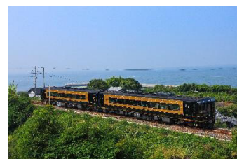
特急「A列車で行こう」