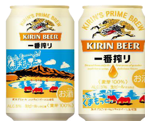
デザインイメージ