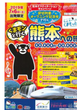
パンフレットイメージ