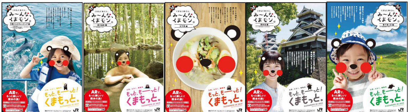
(A) 天草イルカウォッチング

熊本県が制作した5連貼りポスターを、2019年6月1日（土）～30日（日）の間、全国のＪＲ主な駅に掲出します。ＤＣガイドブックでも紹介する、スペシャルコンテンツのＡＲカメラ“ＣＯＣＯＡ Ｒ２”の活用をイメージしたポスターです。