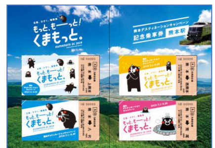
中面デザインイメージ