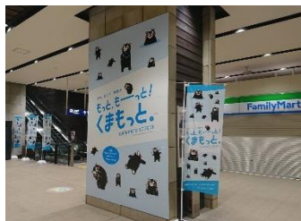
バナー・のぼり旗イメージ

熊本DCの開催期間中、熊本駅の駅コンコースなどでは、熊本DCのバナーやのぼり旗、フラッグなどを設置するほか、JR九州の主な駅ではミニのぼり旗を設置します。