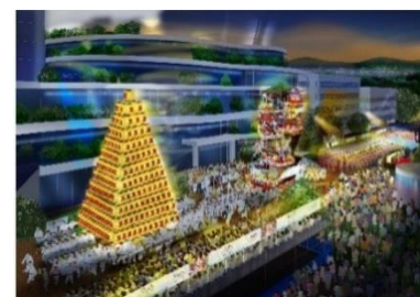
メイン会場イメージ