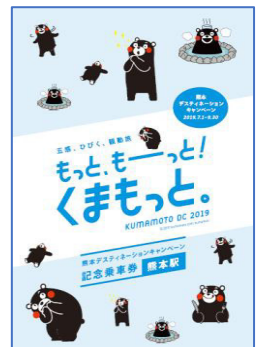
表紙デザインイメージ