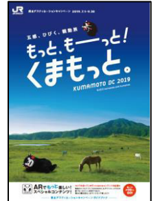
ガイドブック表紙

各エリアの観光情報やキャンペーン期間中に開催されるＤＣ特別企画、イベント情報などを掲載した熊本ＤＣガイドブック約４０万部を、全国のＪＲ主な駅や旅行会社窓口を中心に配布します。