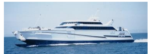
熊本フェリー オーシャンアロー