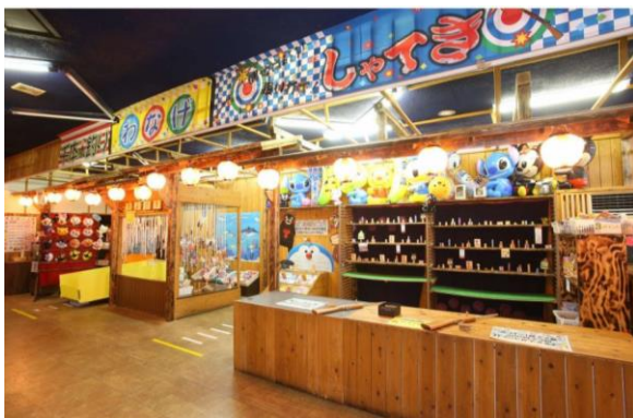
出展：阿蘇内牧温泉湯巡追荘HP