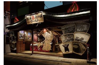
熊本火の国ワールド (協力店舗の一例)