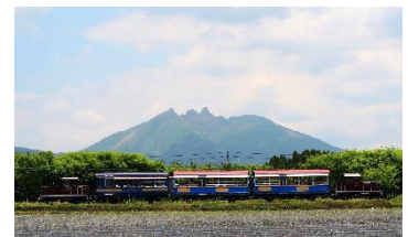
南阿蘇鉄道「ゆうすげ号」

○設定期間：土曜、日曜、祝日及び2019年7月20日（土）から9月1日（日）の毎日