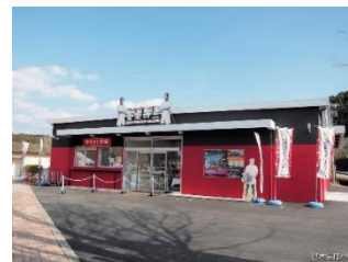
金栗四三ミュージアム