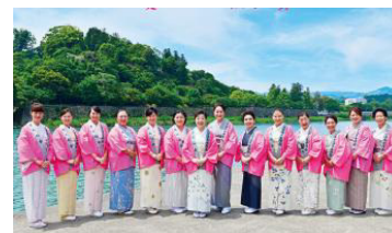
人吉温泉さくら会