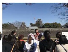
ガイドツアーのイメージ