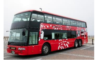
レストランバス外観