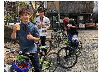
たベコギのイメージ