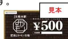
ショッピングチケット イメージ