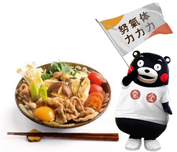
オリジナルメニューのイメージ