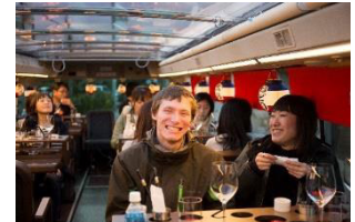
レストランバス車内イメージ