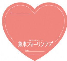
※メッセージシールイメージ