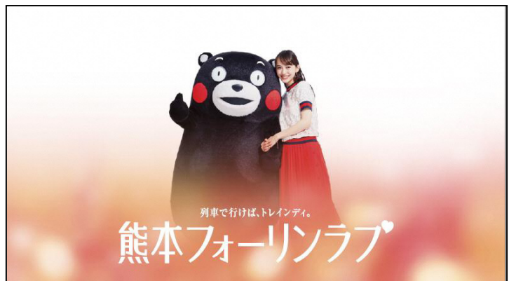
※愛の告白ボードイメージ