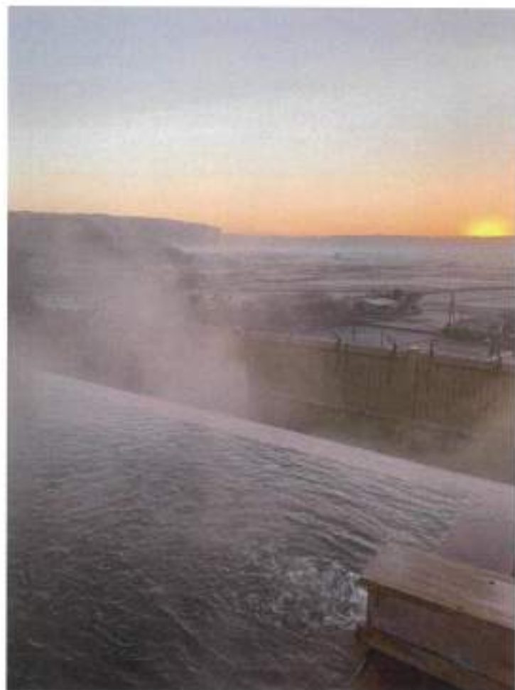
阿蘇・内牧温泉 阿蘇プラザホテル

世界最大級の カルデラの後縁を歩く楽しみ 少しデロ少しデロ 明るくなっていく。 新しい1日の始まりです。 露天風呂に身を沈めながら 日の出を眺める時間は、 言葉では表せないほどの 美しい時間。