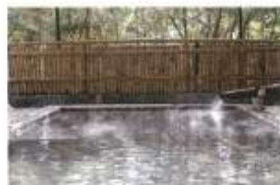
洗阿蘇の宿やまなみ