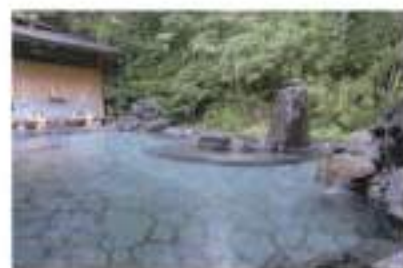
四季の星はひかり