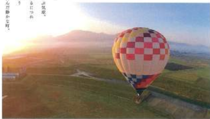
阿蘇キイターランド

空気が穏やかな朝に カルデラの中心に浮かぶ気球。 ゆっくりと上空に上がるにつれ 見えてくる景色が変わり 眼下には、うっすら白んだ静かな町。 目の前には、阿蘇五岳の雄姿。 そして昇る朝日。 空気を眺めるのを 忘れてしまうほどの感動が待っています。