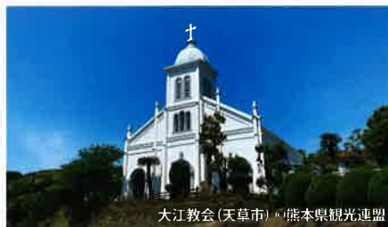
大江教会(天草市)