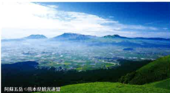
阿蘇五岳