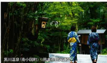
黒川温泉(南小国町)